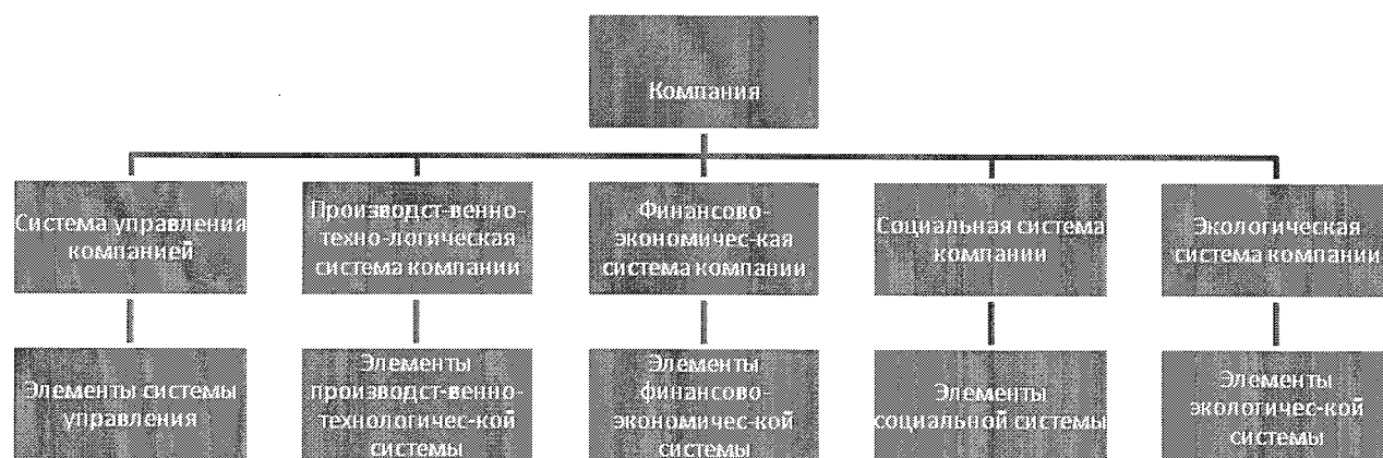
Рис. 1. Рисковые экспозиции компании 2